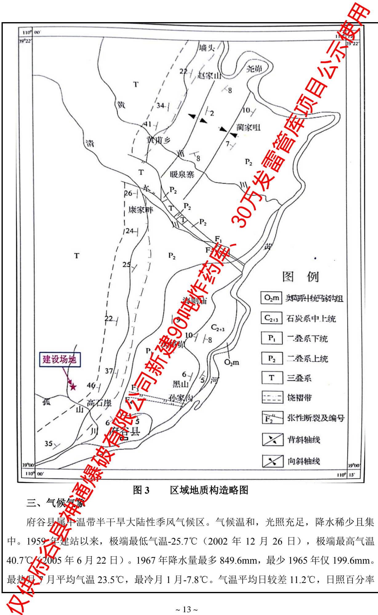
图3 区域地质构造略图